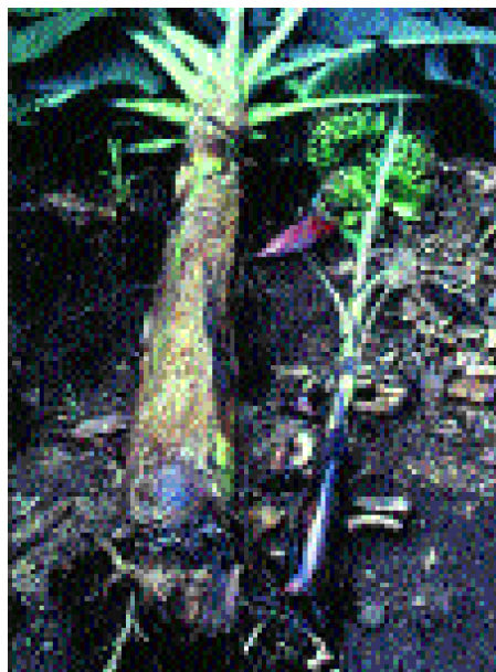
4. Chute de bananier due à la destruction des racines.