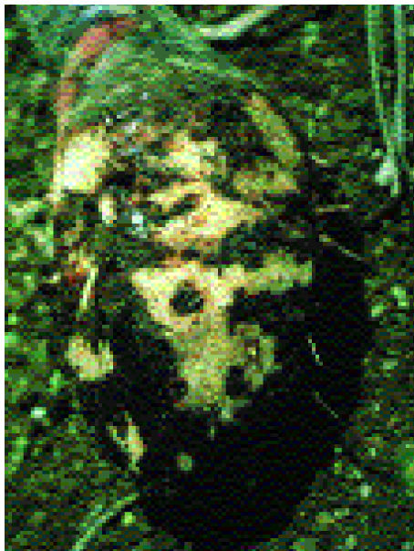
3. Nécroses sur souches (black head disease).

sept semaines d'inondation peuvent être aussi efficaces que 10-12 mois de jachère. Cependant l'inondation est rarement réalisable car elle requiert un terrain parfaitement plan et une alimentation permanente en eau. La fumigation du sol est très efficace contre les nématodes, toutefois peu de composés sont encore autorisés et les coûts d'application peuvent être élevés. De plus, les fumigants sont des biocides non-sélectifs ayant des effets négatifs sur la biologie des sols.