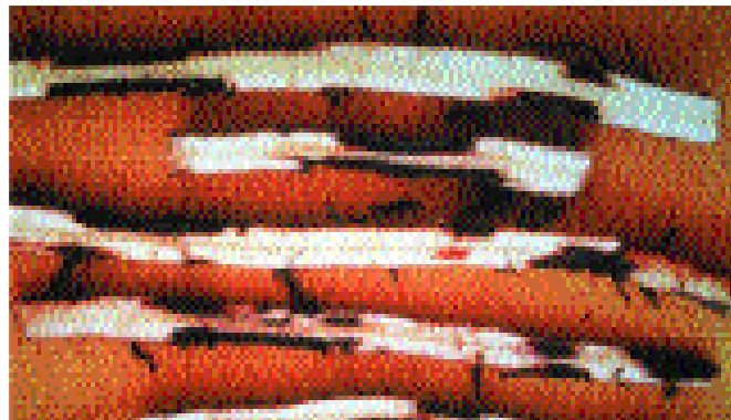
2. Nécroses sur racines. Toute l'épaisseur du parenchyme cortical peut-être atteinte, mais le cylindre central est indemne.

la croissance et du développement des plants. Cela peut entraîner de sévères réductions du poids des régimes et accroître l'intervalle de temps entre deux récoltes. De plus, la destruction des racines diminue l'ancrage des plants dans le sol, augmentant les risques de chutes (Photo 4), particulièrement lors des périodes cycloniques, avec un fort impact économique.